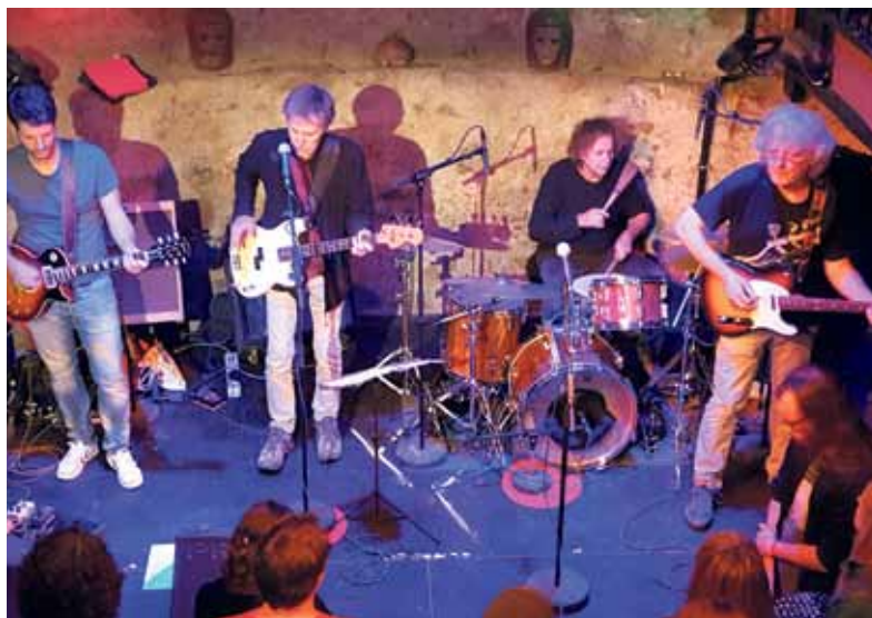
Für manch einen unglaublich, aber wahr: Die „Abriss-Band“ bei ihrem letzten Auftritt in der Bastion.

Ein Meilenstein in der Geschichte der Band war sicher die Eröffnung des Rollschuhplatz-Festivals im Jahr 1999. Vor 800 be-