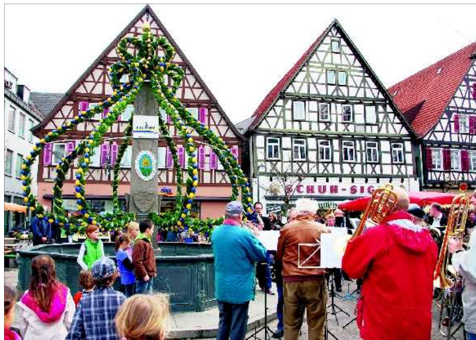
Seit Samstag präsentiert sich der Kirchheimer Marktbrunnen wieder als Osterbrunnen in den Stadtfarben und mit frischem Grün. Zur feierlichen Übergabe der Arbeit des MSSGV spielte die Gruppe „Herbstwind“.

Freude herrschte bei allen darüber, dass das einzige Nass an diesem Vormittag aus dem Brunnen sprudelte. Tatsächlich hatte Petrus ein Einsehen und sorgte bei frühlingshaften Temperaturen für den einen oder anderen Sonnenstrahl. Der lange Winter war die große Unbekannte in der Vor-